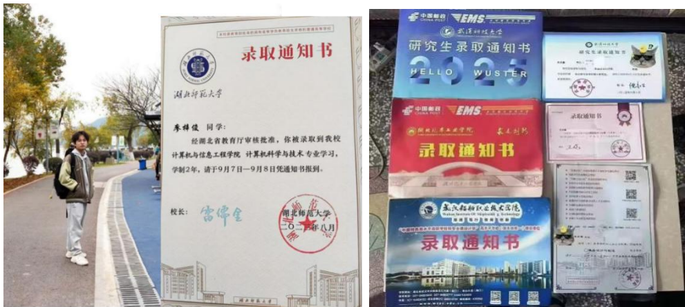
图 1-8 部分优秀毕业生录取通知书