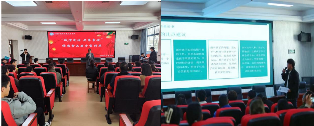
图 5-6 校园食品安全宣传周活动现场