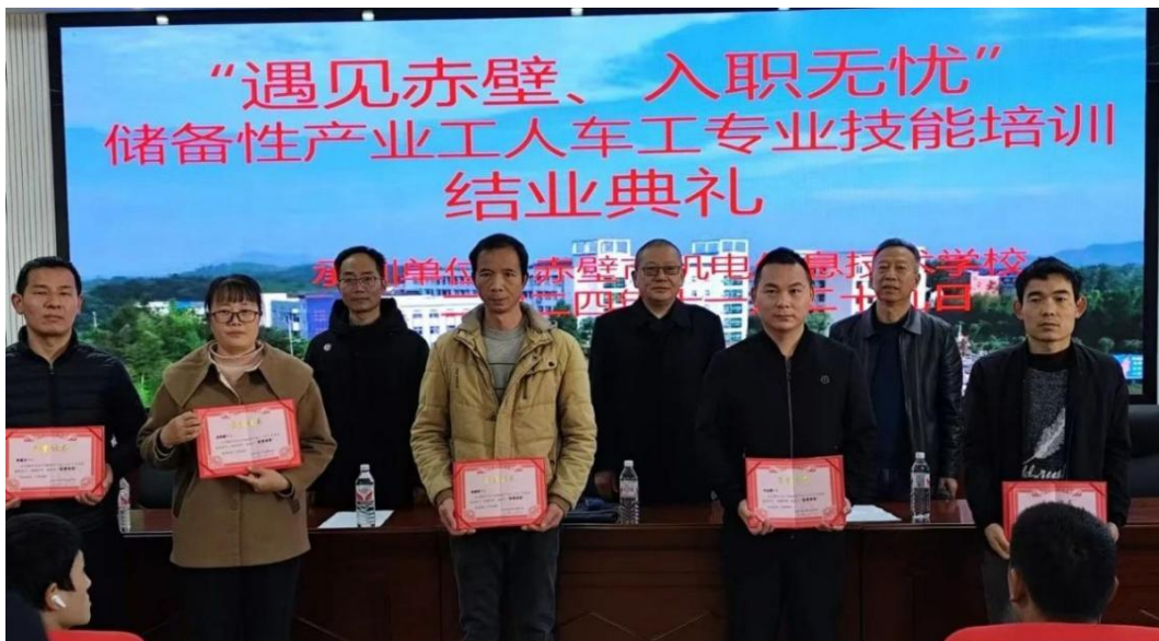
图 2-1 人社局领导为学员颁发结业证书