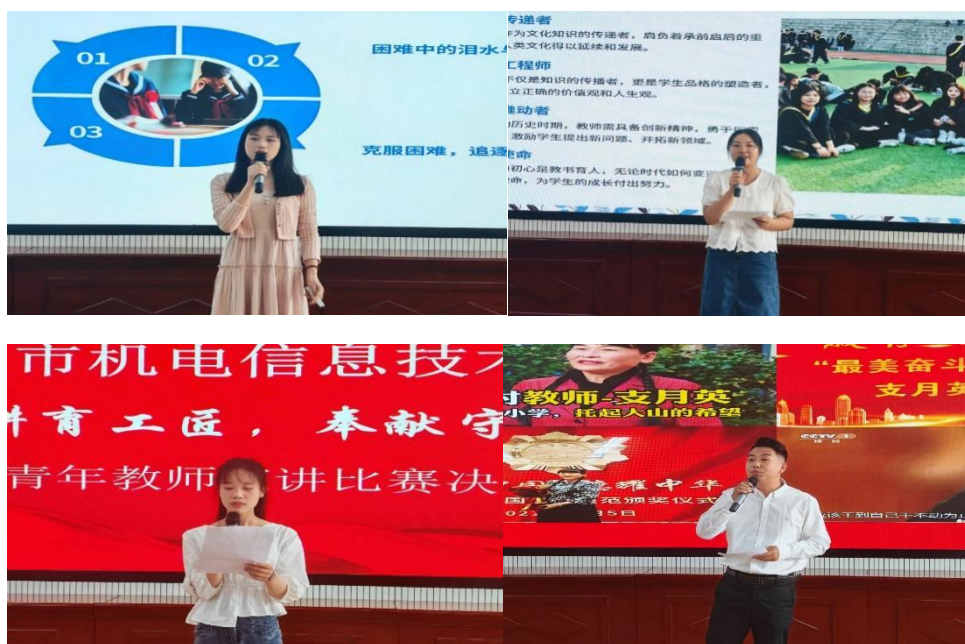
图 1-10 部分青年教师在自述育人故事

这不仅是一场比赛，更是一次故事的交流，一次精神的洗礼和力量的凝聚。它充分展现了青年教师队伍蓬勃向上的精神风貌，勉励全体教师继续扎根职教沃土，积淀育人智慧，用自我成长陪伴学生的成才之路。