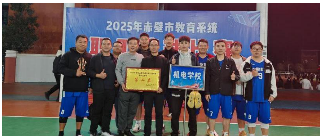
图 5-2 我校教职工男篮勇夺 2025 年赤壁市教职工篮球赛亚军

以党建带群团建设，健全学校青、工、妇组织，保障和维护教师利益，关心教职工的工作、学习和生活，关爱教师和学生，积极主动为他们解决后顾之忧，以凝聚人心，调动各方积极性。学校工会还不定期组织教职工开展各种文体比赛活动，积极参加上级部门举行文体比赛活动，在 2025 年赤壁市教职工篮球赛中，我校教职工男篮奋勇拼搏获得亚军；为缅怀革命先烈，传承红色基因，厚植爱国情怀，4 月 2 日，我校组织高一、高二年级师生徒步前往赤壁市烈士陵园，开展 2025 年清明祭英烈活动，以诚挚的感情，庄严的仪式缅怀先烈，寄托哀思。2025 年 4 月 18 日，我校团委与学生会组织的近百名学生青年志愿者高举校旗、团旗，身穿红马甲，迎着朝阳，排成整齐的队伍前往凤凰山社区，以“社校携手净家园，劳动实践促成长”为主题，开展清扫村湾环境卫生的志愿服务活动，用实际行动践行新时代中职学生的社会责任感。