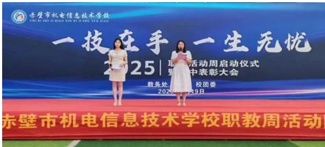
图 3-4 2025 年职教活动周启动仪式

启动仪式的每个节目都是一颗星，在机电校园的夜空里各自闪耀。打击乐的炸裂是勇气，民族舞的婉约是匠心，运动表演的汗水是拼搏，独唱的温柔是梦想。这些闪光的瞬间，终将汇聚成照亮未来的星河。