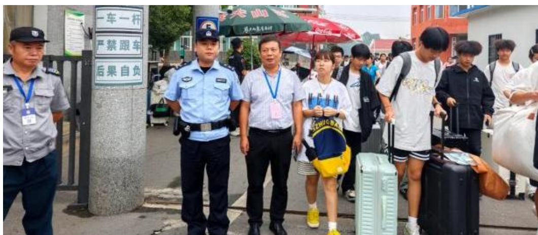
图 1-5 学生放假，警、校、社联动守护学生安全

一场联动，多方聚力；一份守护，温暖人心。蒲圻派出所、凤凰山社区与赤壁市机电信息技术学校的携手，不仅为学子们筑牢了安全屏障，更传递了社会对青少年成长的深切关怀。未来，三方将继续深化合作，用法治之光、社区之爱、校园之暖，共同照亮青春前行之路。