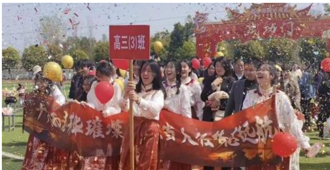
图 1-3 老师、家长同学生一起经过成功门