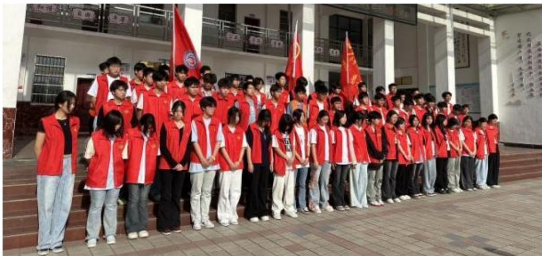
图 5-4 学校志愿者集合中

此次社校联动不仅改善了村湾环境卫生面貌，更搭建了实践育人平台。学生在劳动中增强了社会责任感，村民提升了文明环保意识，实现了"教育一个学生、带动一个家庭、文明一个村湾"的良好效果。未来，校社将持续深化合作，常态化开展共建活动，共同打造整洁、文明和谐的美丽家园。