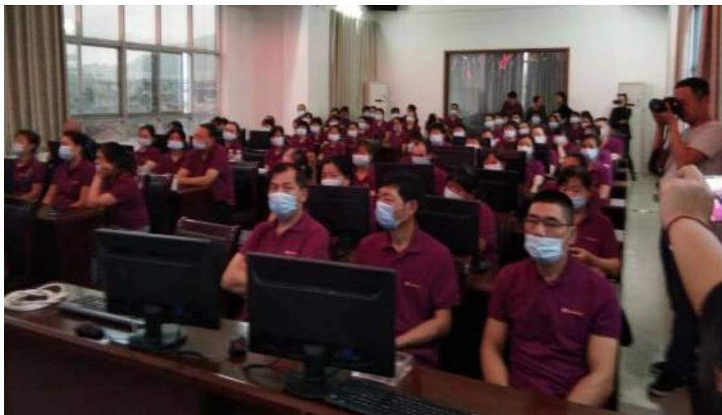
图 2-2 劳动预备制培训