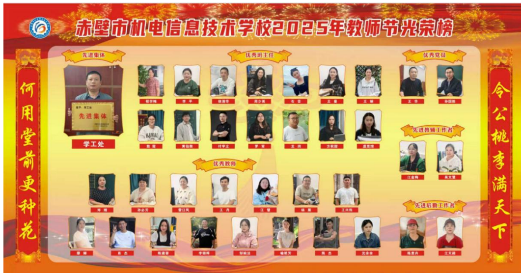
图 5-1 2025 年度教师节光荣榜