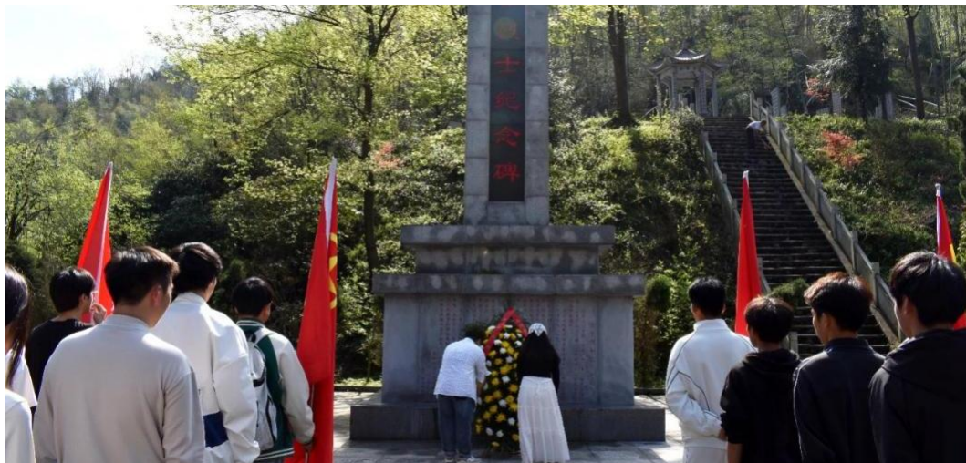
图 3-1 师生给烈士献花