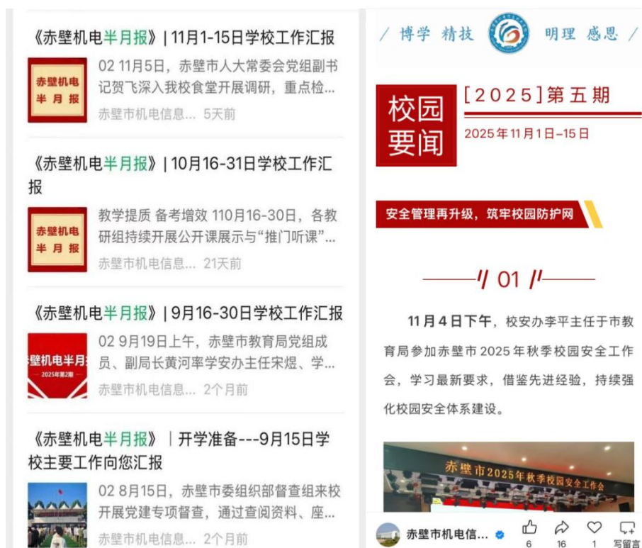
图 5-5 赤壁机电半月报