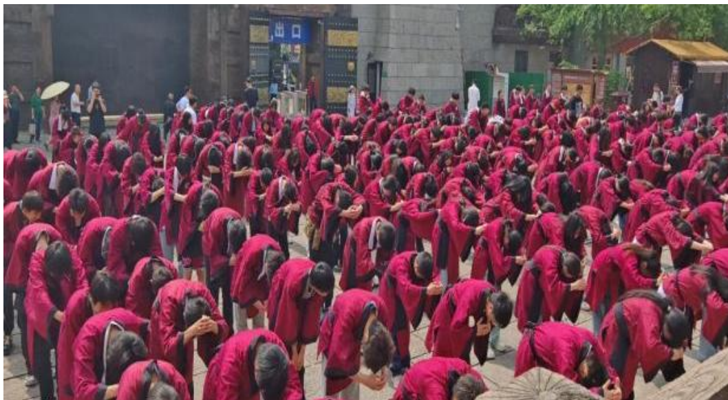
图 3-2 学生在赤壁古战场研学