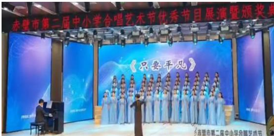
图 1-4 繁星合唱团在表演