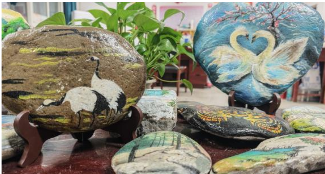
图 1-9 美术第二课堂部分学生作品展示

本次石头画第二课堂成功调动了学生参与热情，作品丰富多样，展现了良好的美育成效。关键经验在于：一是将趣味性与专业性结合，使第二课堂成为技能延伸的平台；二是鼓励个性化表达，保护了学生的创作积极性。未来可进一步探索与企业合作，将优秀作品开发为文创产品，实现“学以致用”的深化，持续赋能学生成长。